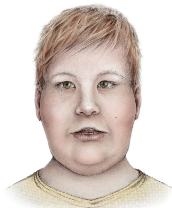
Illustrasjon: Malin Bernas, TAKO-senteret

TAKO-senteret har over lengre tid jobbet med diagnosebeskrivelser beregnet til helsepersonell.