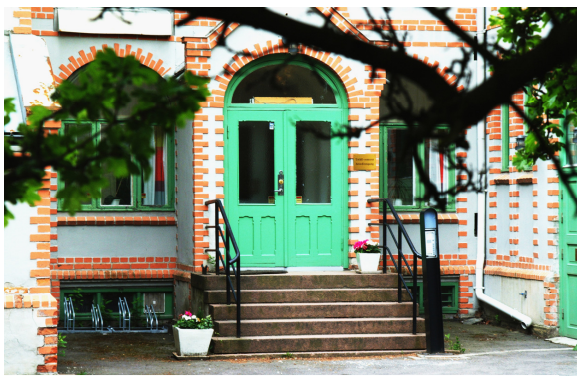
I dette lokalet holdt TAKO-senteret til tidligere.

Jubileet feires som fagdag med forelesninger og forskningspresentasjoner av inviterte gjesteforelesere og ansatte. I august åpnes det opp for påmelding.